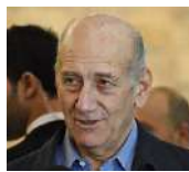
Ehud Olmert, Ancien Premier Ministre d'Israël (2006-2009)