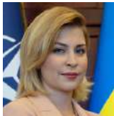
Olga Stefanishyna, Vice Première Ministre d'Ukraine