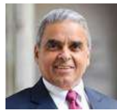
Kishore Mahbubani, Former President for the UN Security Council